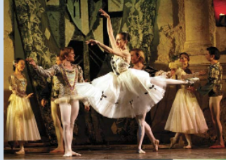
Bailarinas interpretando el ballet El lago de los cisnes .